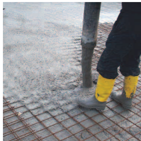
EASYCRETE® – lehce zpracovatelný beton