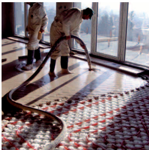
ANHYMENT® – litý samonivelační potěr