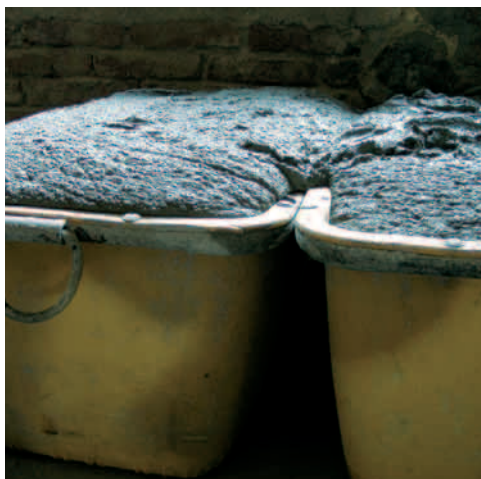
MALMIX® – čerstvé maltové směsi