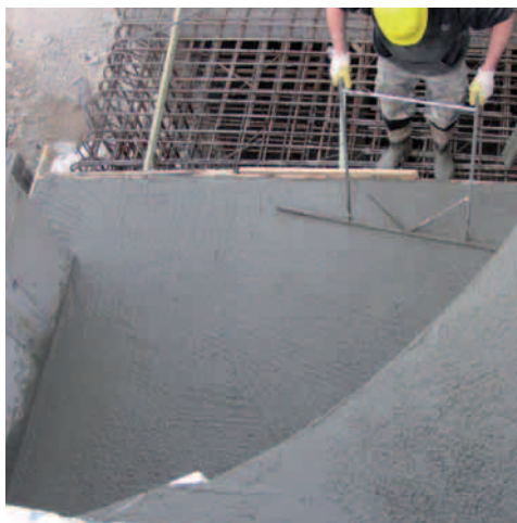
PORIMENT® – cementová litá pěna